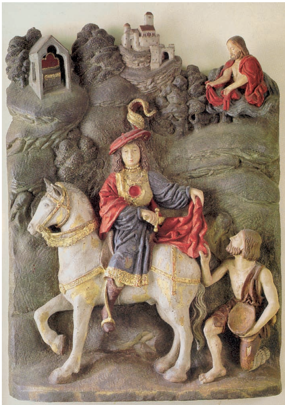
St. Martin, Hellefeld/Sauerland